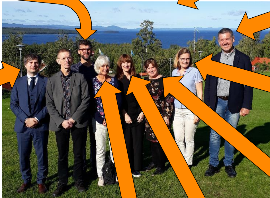
Tällberg (Region Dalarna)