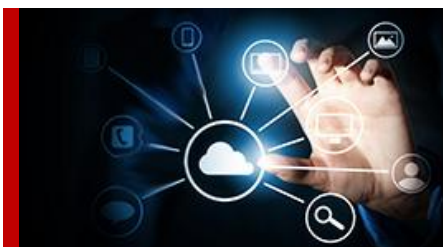
e-ID, signering och autentisering