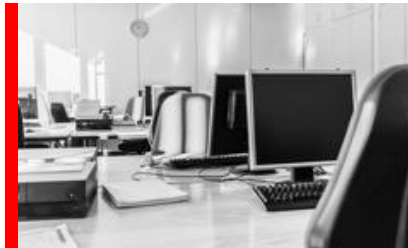
Arbetsplatser och elevdatorer