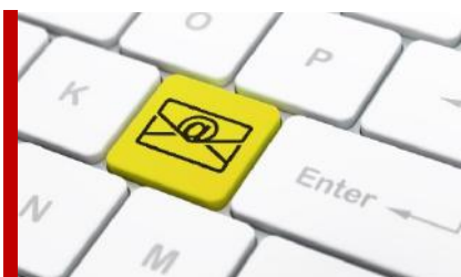
Säker Digital Kommunikation