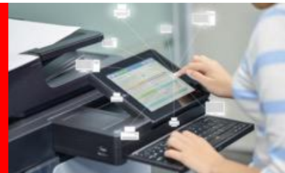
Digitala och fysiska utskriftstjänster