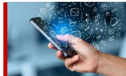
(Digitala lås) Säkerhetsteknik