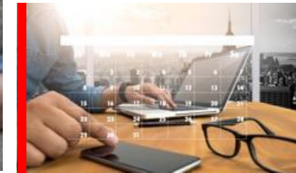
Boknings- och bidragslösningar