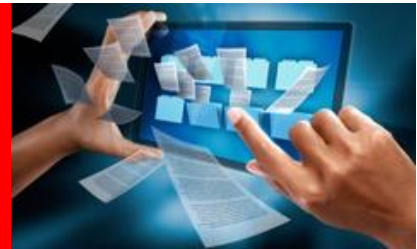
E-arkivlösningar inkl. anskaffningstjänster