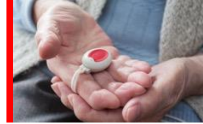
Digitala trygghetslarm och larmmottagning