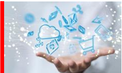
Programvaror och molntjänster